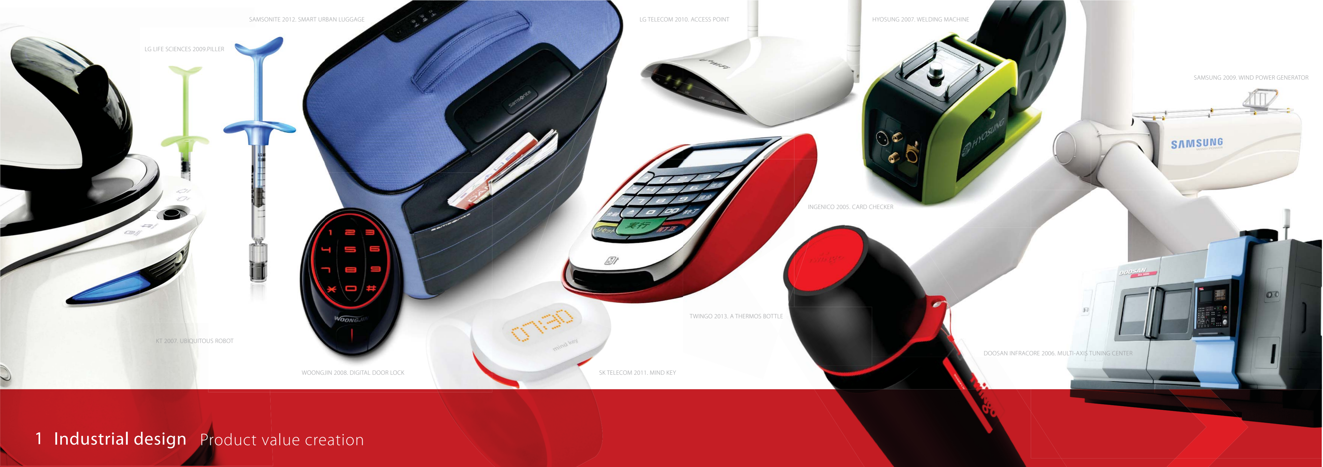
LG LIFE SCIENCES 2009. PILLER